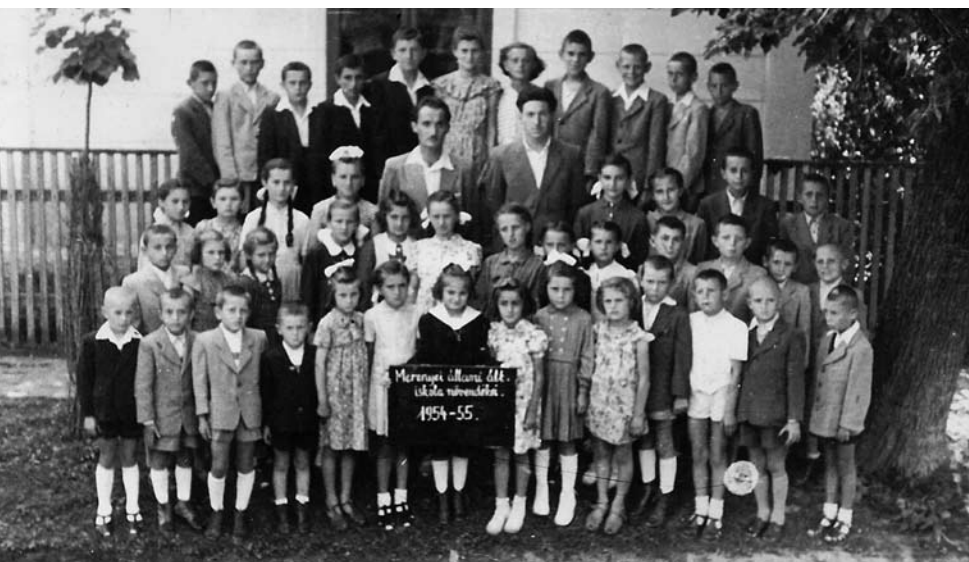
■ AZ 1954/55-ÖS TANÉV DIÁKJAI ÉS TANÍTÓI