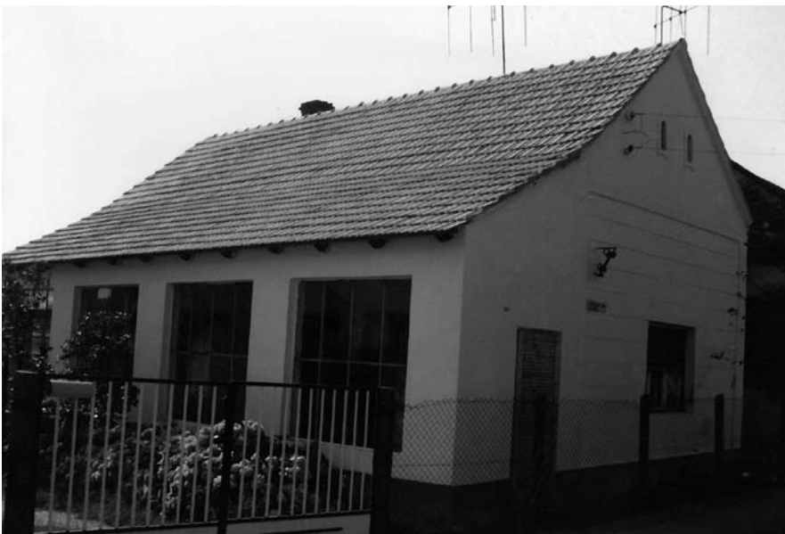
■ A MERENYEI ISKOLA ÉPÜLETE