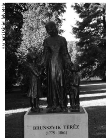
■ BRUNSVIK TERÉZ SZOBRA A KASTÉLYPARKBAN

a gyermekek, akik nem jártak óvodába, többségükben később jobban tudtak játszani, kreatívabbak, tanulékonyabbak voltak. A kicsik túl korán válnak intézménylakókká. A játékhoz intimtásra lenne szükségük, de ott, ahol harminc óvodás játszik, ez nem valószínű. Az óvodapedagógia dolga, hogy mégis elviselhetővé tegye számukra az intézményes légréteget. A játékhoz magány is kellene, és olyan felnőtt, aki minden rezdülésüket ismeri. Az óvónők tudásán, rátermettségén múlik, hogy a gyermekek elfogadják, megszeressék ezt a közeget. Kosztolányi Dezső A kis kutya című verséből vett idézettel illusztrálta, milyen fontos a gyermek számára, hogy egyedül, a maga életritmusában szemlélődhessen: „csodálva nézem sokszor órahosszat / és fürgé szívverését számolom.” Ebből a felfedezésből állnak össze azok a „tudásmorzscsákák”, amelyek az iskolában fogalmi gondolkozássá válnak.