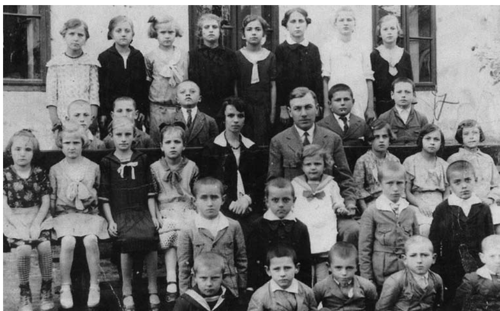
■ CSOPORTKÉP AZ 1927/1928-AS TANÉVBŐL

A gyerekek zöme a faluban lakott, de ide jártak a szomszédos pusztákról: Cegléd-szentmiklósról (őket urasági fogatos kocsin szállították) és Gombkötőről, sőt néha még Görösgalpusztáról is a tanulók. A szülők foglalkozása: földműves, uradalmi cseléd, községi kanász, esetenként molnár, borbély, útmunkás.